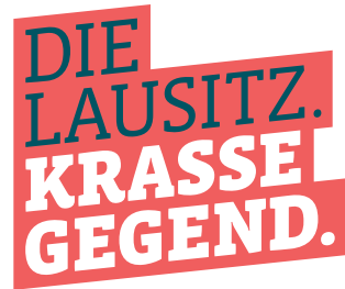
Logo ohne URL