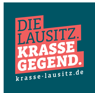
Logo mit weißer URL auf einfarbigem Hintergrund